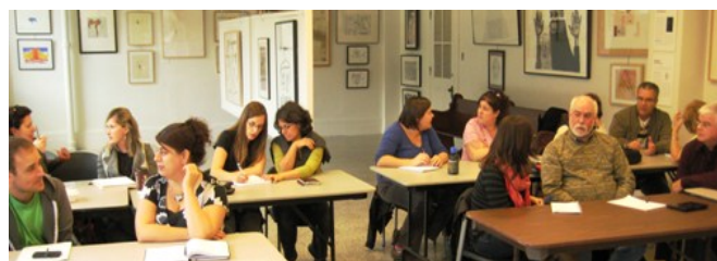
Avec la collaboration de la CRÉ Gaspésie-les-Îles 23 oct. 2012. Gaspé.

Le GFPD est fier de s'être associé aux partenaires locaux et régionaux pour maximiser les retombées de ces formations ! Votre collaboration est précieuse pour le succès de cette initiative!