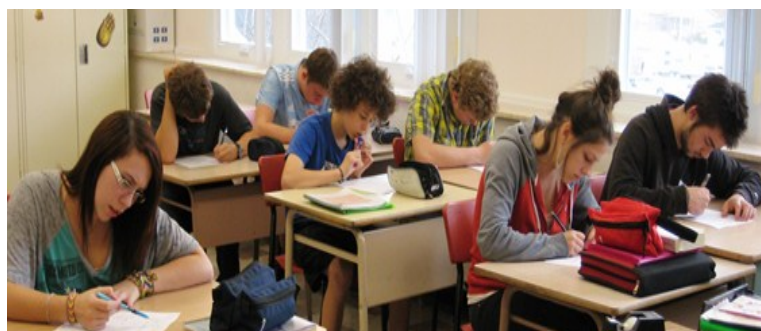
École secondaire Les Prospecteurs, Murdochville. 18 oct. 2012.

Merci à : la Commission jeunesse Gaspésie-les-Îles; aux professeurs des écoles secondaires; à la CRÉ GÎM; à Place aux jeunes Côte-de-Gaspé; au CJE de la Haute-Gaspésie et à celui des Îles ainsi qu'à la Sentin'Elles.