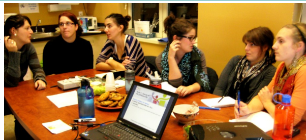
Commission jeunesse consultative des Îles 1 er nov. 2012.