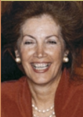
L'honorable Lucie Pépin Sénat du Canada