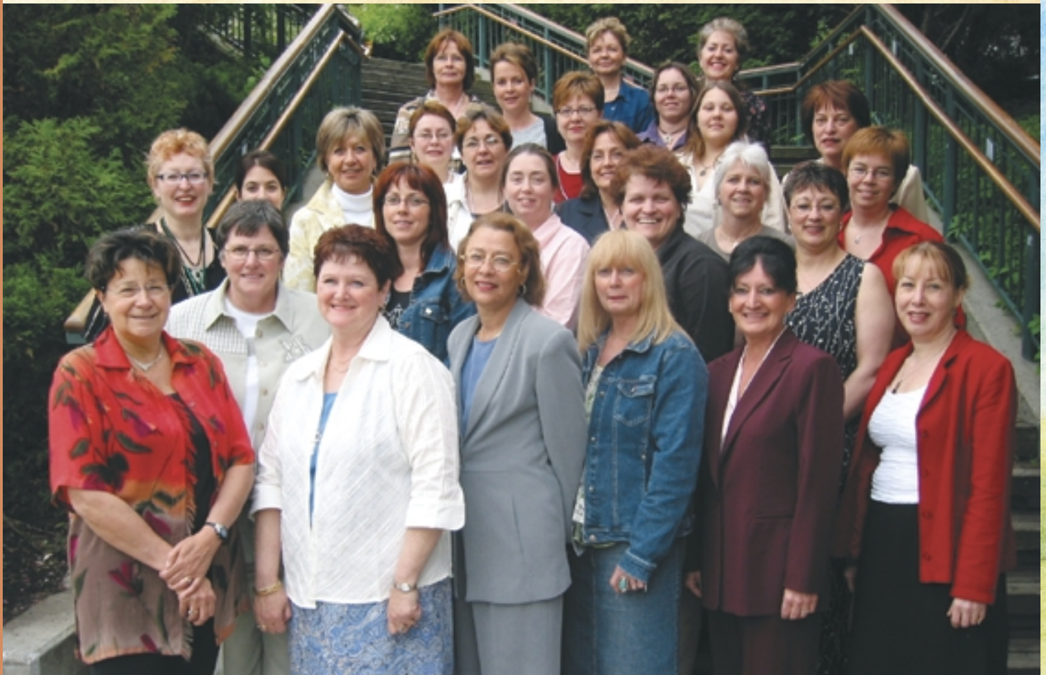
Les participantes et l'équipe d'animation de l'École d'été Femmes et Démocratie municipale , 2004