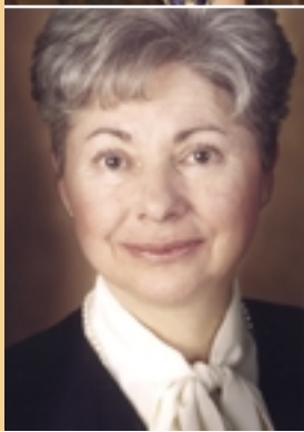
Mme Vera Danyluk Mairesse de Ville-Mont-Royal de 1987 à 1993 Présidente de la CUM de 1994 à 2002