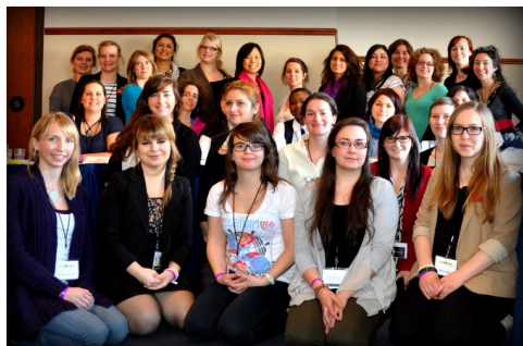
Les participantes et des collaboratrices de l'ÉFD de février 2012 à Shawinigan

L'École Femmes et Démocratie pour les leaders étudiantes, qui s'est tenue à Shawinigan du 10 au 12 février, a connu un grand succès. Trente jeunes leaders, de « futures ministres » comme l'a souligné l'une des formatrices, ont participé activement à cette session intensive de formation. Le GFPD a travaillé en étroite collaboration avec Geneviève Baril, de l'Institut du Nouveau Monde, qui en a assuré la coordination. Merci aux formatrices et aux formateurs ! Bon succès aux participantes dans leurs projets d'avenir !