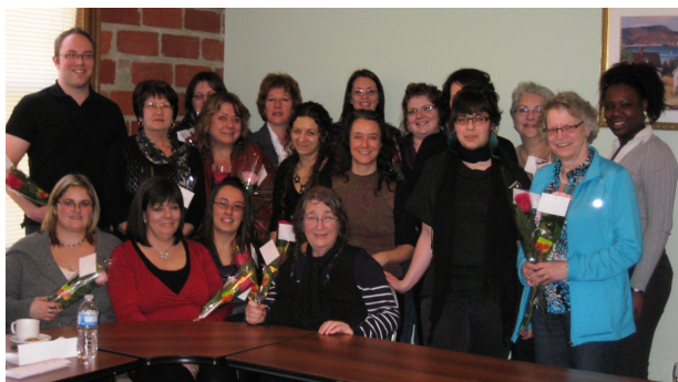
Photo de groupes de participant-es dans la cadre de la tournée Pot aux roses le 2 février 2012 à Baie-Comeau

Prévenir les inégalités et encourager la participation à part égale des deux sexes au niveau des instances locales et régionales de la Côte-Nord, tels étaient les objectifs visés par cette tournée.