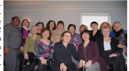
Les participantes, formatrices et organisatrices à l'Agora d'Hypatie des 2 au 4 mars dernier à Sutton

C'est en pleine nature et dans un décor enchanteur que s'est déroulée, du 2 au 4 mars dernier, la 2 e édition de l'Agora d'Hypatie à l'Auberge l'Arc-en-ciel à Sutton. Invitées à faire le bilan de leur vie professionnelle et à découvrir leur profil